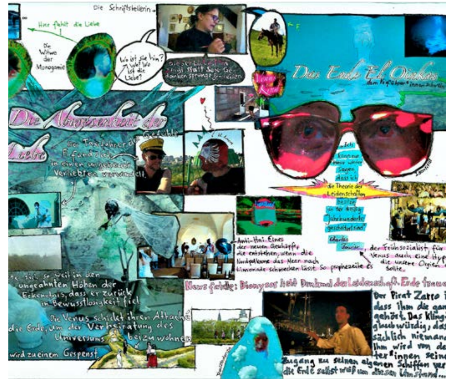
Zeichnung zum Film „die Abwesenheit der Liebe“